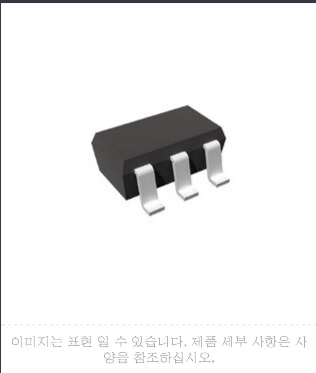
이미지는 표현 일 수 있습니다. 제품 세부 사항은 사양을 참조하십시오.