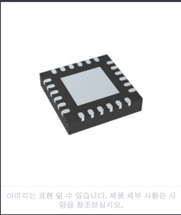
이미지는 표현 일 수 있습니다. 제품 세부 사항은 사양을 참조하십시오.