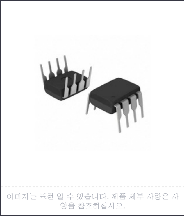
이미지는 표현 일 수 있습니다. 제품 세부 사항은 사양을 참조하십시오.