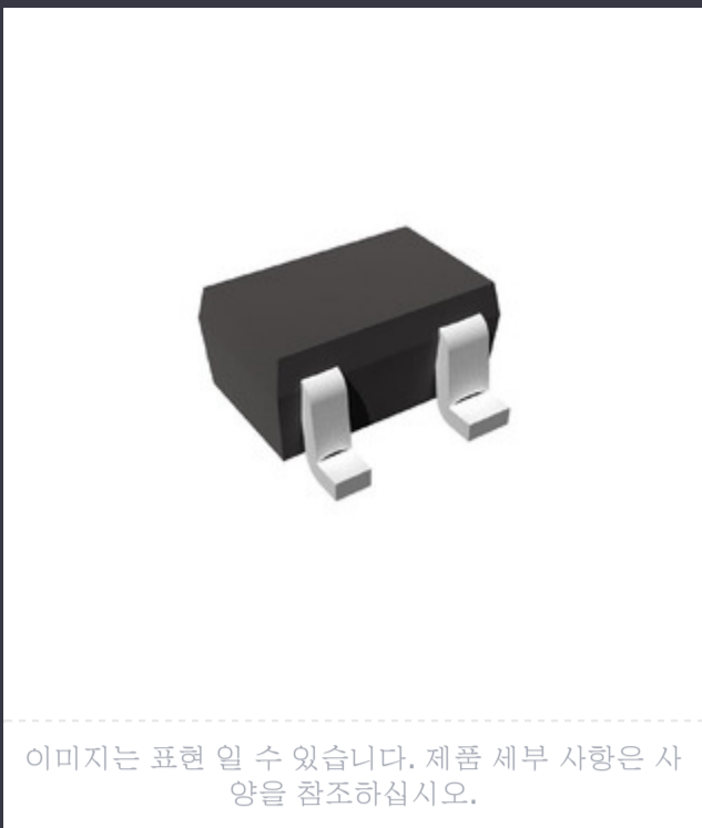
이미지는 표현 일 수 있습니다. 제품 세부 사항은 사양을 참조하십시오.